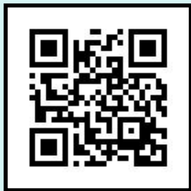
學務綜合資訊平台